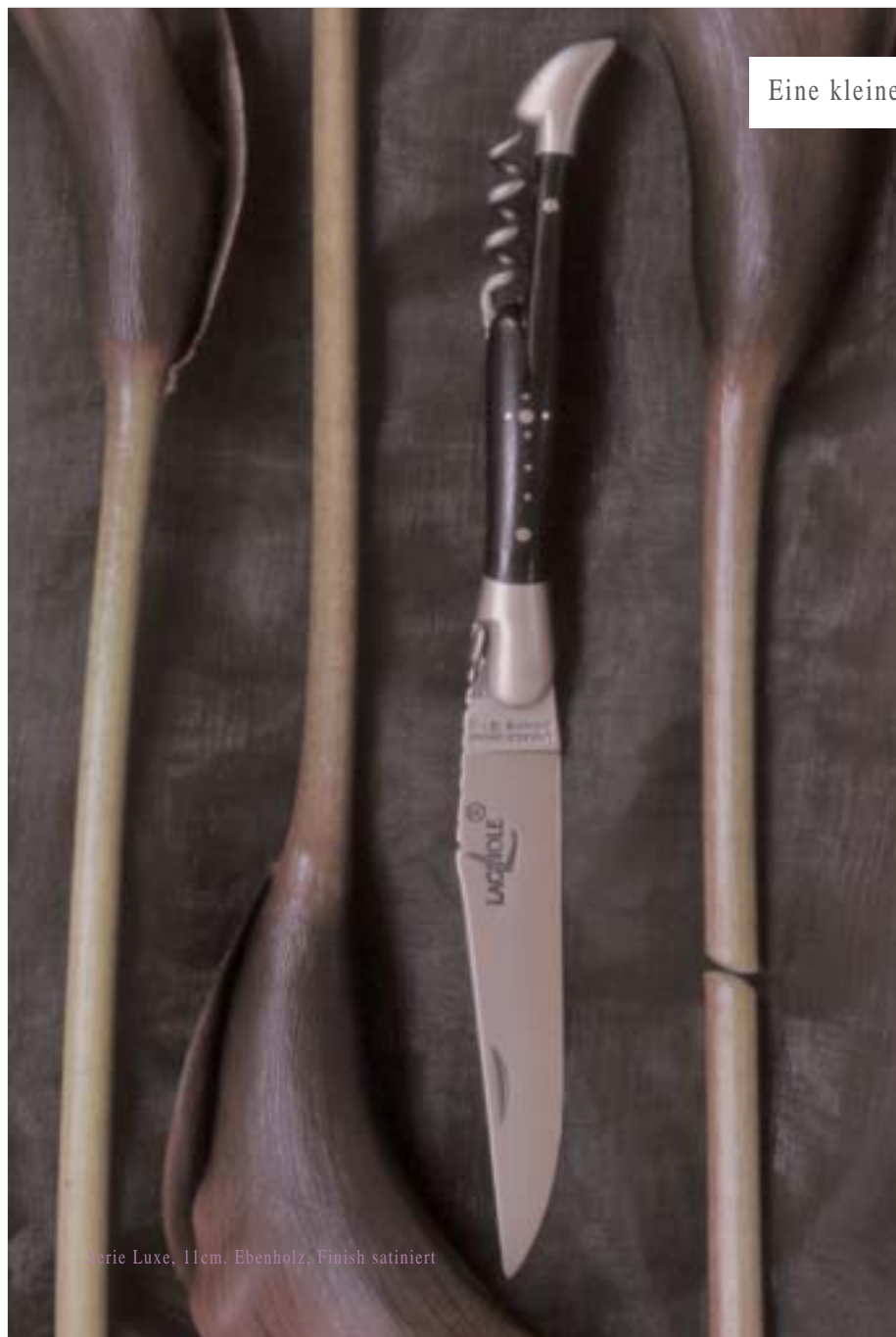
Serie Luxe, 11cm. Ebenholz, Finish satiniert