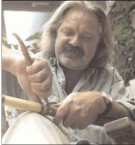
Ekke. Braas, www.laguiole-messer.de

Frankreich. Schon immer hat mich dieses Land fasziniert. Seine Landschaften, Gerüche, Geschmäcker. Der Holzrauch über den Dörfern. Ländlich einfaches Leben, authentisch.